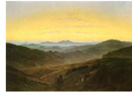
Caspar David Friedrich Vor Sonnenaufgang im Riesengebirge