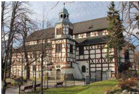
Friedenskirche in Jauer